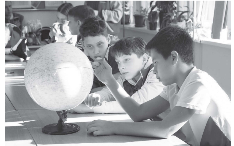
Участники третьей смены из д/л «Штормовой», Гагаринские старты