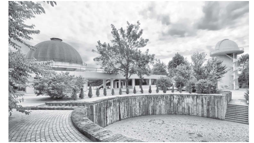
Обсерватория ВДЦ «Орлёнок»

сложных научных проектов – обсерватория прошла долгий путь, оставаясь неизменным символом стремления к знаниям и открытиям.