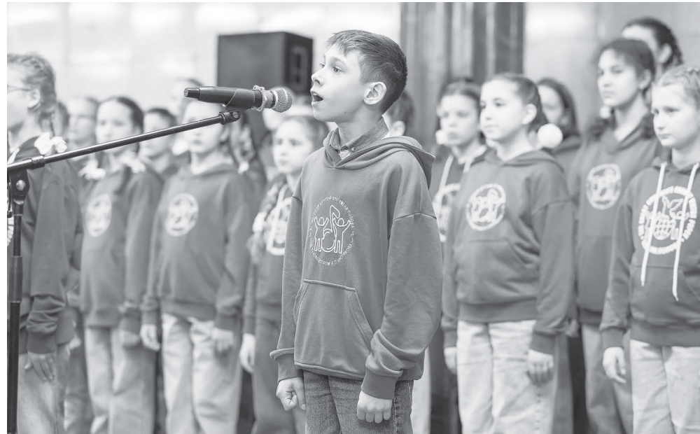
Большой детский хор им. В.С. Попова на площадке «Музыка в метро» в поддержку акции «Орлята учатся летать».