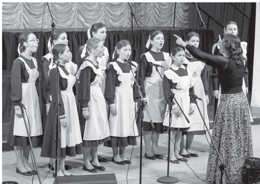
Хоровой ансамбль «Скворушка», Ярославская область, во время конкурсного отбора в номинации «Песни Великой Победы»