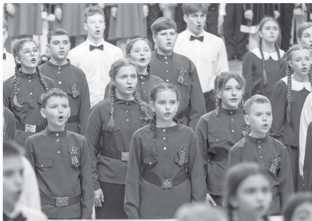
Сводный хор участников Финала Всероссийского конкурса хоровых и вокальных коллективов во время записи песни «Всё о той весне»