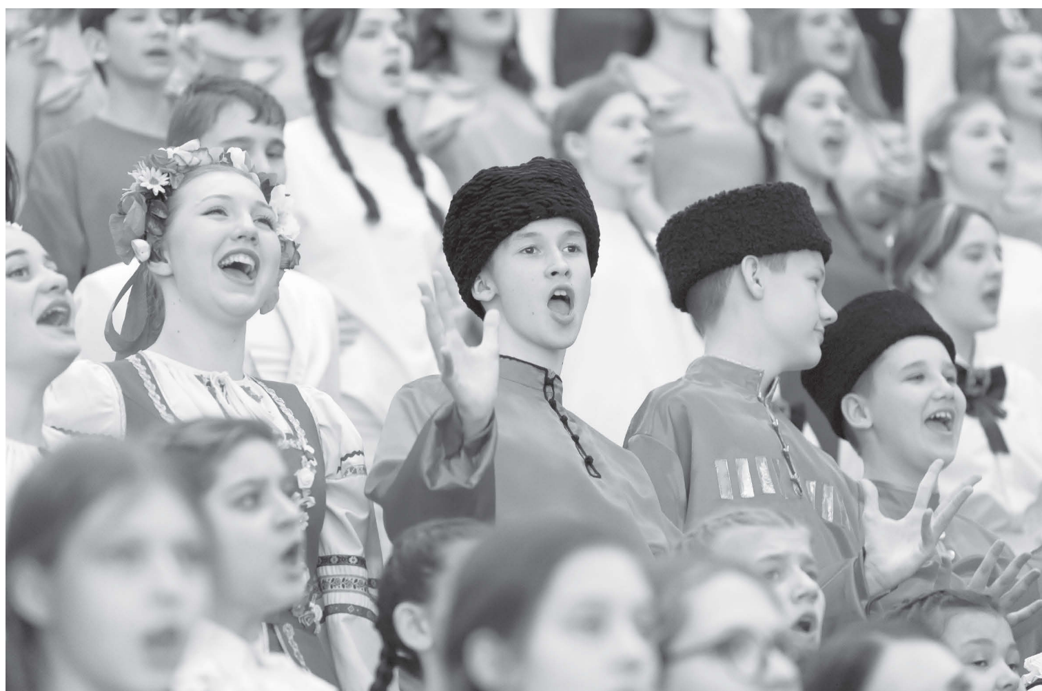
Участники сводного хора во время записи песни «Орлята учатся летать»