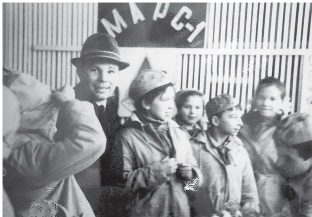
Юрий Алексеевич Гагарин в пионерском лагере «Орлёнок», ноябрь 1964 года

Каждый год 12 апреля мы отмечаем День космонавтики. Его утвердили в 1962-м году указом Президиума Верховного Совета СССР. Как связан ВДЦ «Орлёнок» с космосом? Есть ли орлята, которые осуществили свою мечту о бескрайнем космосе?